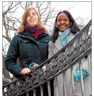
JUNGES DUO Harmonie zwischen Klavier und Oboe.