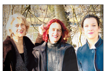
MUSIKERINNEN Sie vermischen mit ihren Liedern Zeiten.

KONZERT So, 9. März, 17 Uhr, Zwinglikirche Bözingen-Biel.