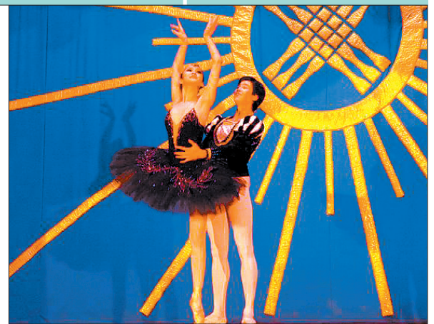
«KYZ-ZHIBEK» Die Geschichte um das Seidenmädchen.